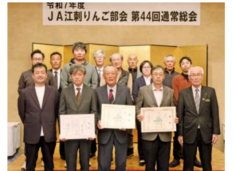
▲りんご品質共励会の受賞者の皆さん