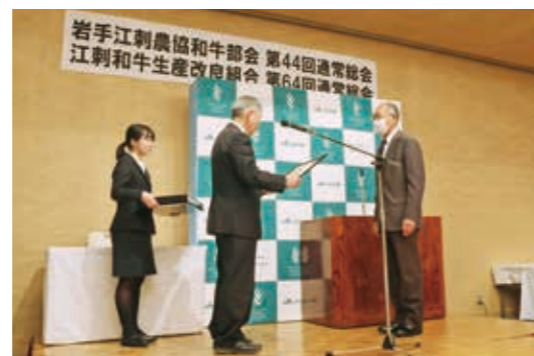
子牛販売共励会団体部門の褒賞授与▶