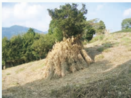
▲茶草の乾燥「かつばし」