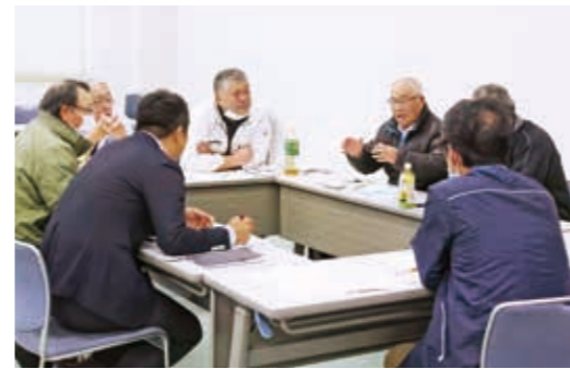
▲意見を出し合う出席者