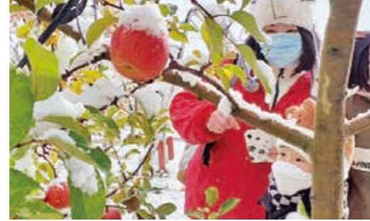
▲真っ赤に色づいたりんごを収穫