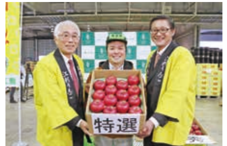
▲100万円で落札された江刺りんご「サンふじ」