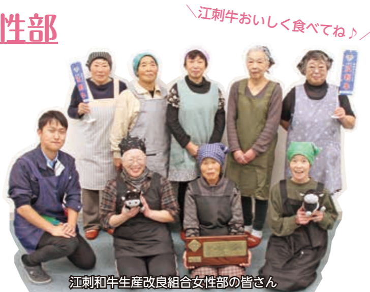
江刺和牛生産改良組合女性部の皆さん

皆さんも年末年始は、江刺牛のうま味をたっぷり感じられる料理でちょっぴり特別な食卓にしてみませんか?