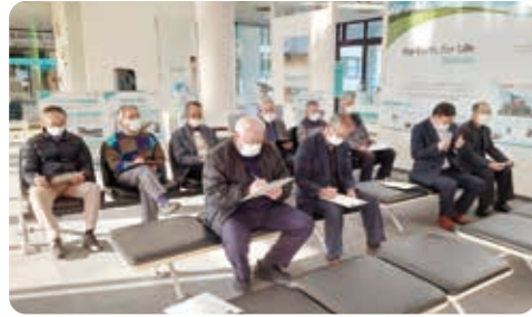
クボタの物づくりについて説明を受ける協議会委員

11月27日、農家組合協議会は、茨城県つくばみらい市にあります株式会社クボタ筑波工場へ視察研修に行きまわりました。委員ら11名が参加し、工場の見学とクボタの物づくりについて学びました。工場は東京ドーム8.7個分の敷地面積があり、エンジンとトラクターを製造しており、工場の大きさとロボットによる作業が多く圧倒されました。また、クボタが描く未来のトラクターなどを見ることができ、今後どのような農業機械が出来るのか将来が楽しみです。