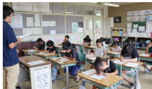
真剣に話を聞きメモをとる児童たち