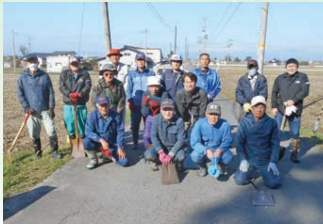
▲江払い作業に取り組んだ皆さん