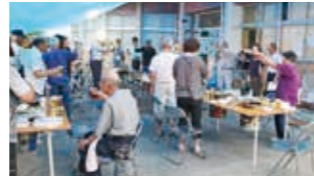
一致団結を誓う参加者ら