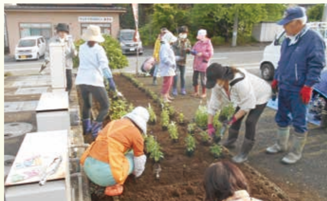
▲6月17日 女性部の花植栽作業の様子