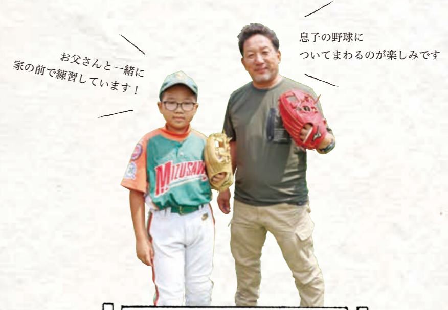
息子の野球についてまわるのが楽しみです お父さんと一緒に家の前で練習しています！