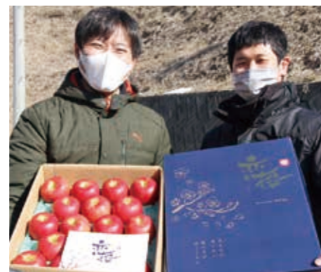
今年も春の訪れを告げたプレミアムりんご「恋桜」

今年も季節限定プレミアムりんご「恋桜」の販売を行いました。「恋桜」は令和2年3月にデビューしたブランドで、JAの貯蔵施設で越年した「奥州ロマン」を、桜の時期に合わせて販売しています。サクサクとした歯ごたえと、栗にも似た強い甘みを感じられる味わいが自慢の恋桜は「春を告げるりんご」として注目を集めており、大切な人への贈り物として選ばれています。