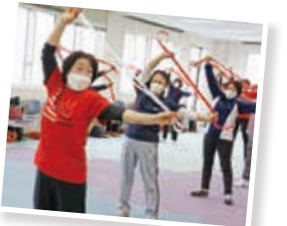
3B体操で体を動かしてリフレッシュ！