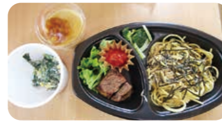
江刺牛の角切りステーキ(トマトソース添え)、キノコの Pasta、ほうれん草のサラダなどが入った「子どもひろば」のお弁当。