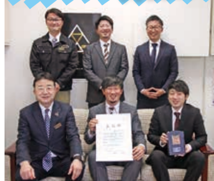
全国大会の報告にJAを訪れた青年部の皆さん。

一緒に活動する仲間を募集中！ 一緒に活動する仲間を募集！ 一緒に活動する仲間を募集！ 一緒に活動する仲間を募集！ 一緒に活動する仲間を募集！