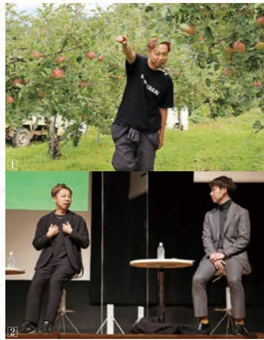
①雑誌「地上」の企画で昨年9月に江刺を訪れていたEXILE USAさん。農業を通じて縁が生まれた。 ②トークセッションを交わすUSAさん(左)と世寿人さん