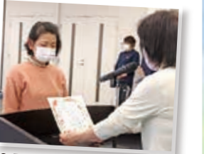
2月14日に閉講。すべての講座に参加した人には皆勤賞が贈られます。