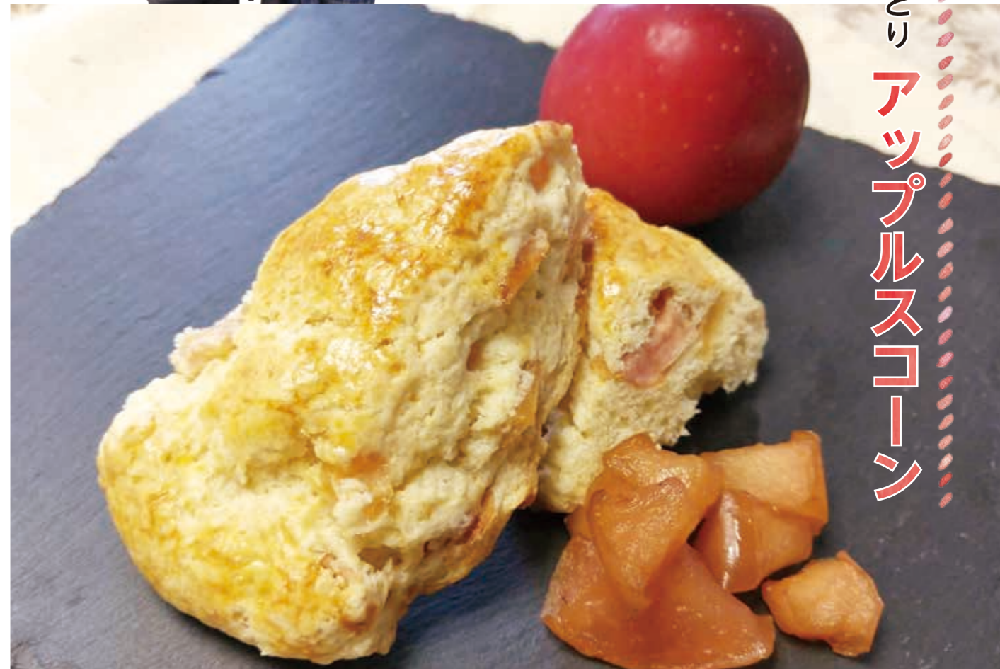
セミドライアップル