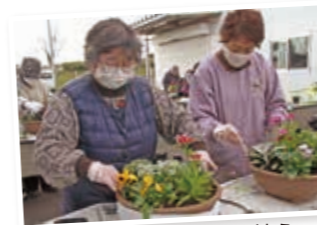
季節の花などを寄せ植え。

毎年大人気のカルチャースクール「生き生き塾」は、自分磨きや仲間づくりを通じて元気に輝くことを目的に開講しています。令和4年度は、寄せ植え講習会、ビー玉とワイヤーを使ってリースを作るマーブルアート教室、江刺金札米と大豆を使ったみそ作り講習など、全6回開催しました。