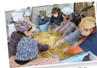
江刺金札米と江刺産大豆を使ってみそを手作り。