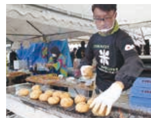
◀毎年大好評の「みそ焼きおにぎり」は、100円以上を募金いただいた方に、お渡ししています