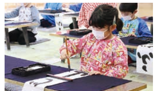
▲真剣に筆を運ぶ園児