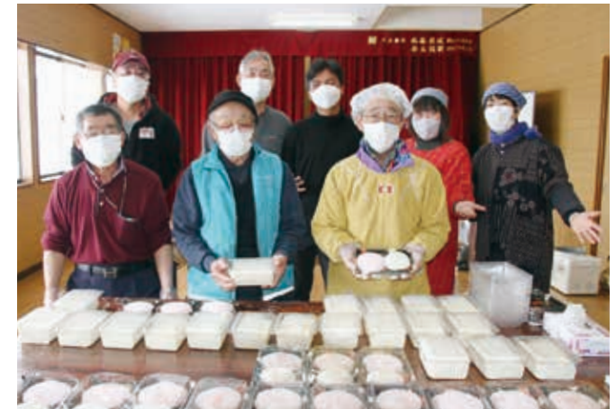
手作りした紅白餅と豆腐を並べる横瀬農家組合役員

横瀬農家組合（藤里）は12月25日、手作りの紅白餅と豆腐を組合員全29戸に届けました。