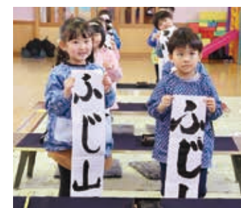
◀「ふじ山」上手に書けました♪

1月4日、暁学園で園児の「書初会」が行われました。同園では5歳児の保育の中で文字指導、毛筆指導を取り入れており、毎年新年に書初会を開いています。