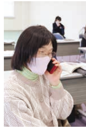
▲LINE通話や、テレビ通話も体験しました

J A江刺は1月10日、女性部支部長を対象としたスマホ教室を本店で開催しました。