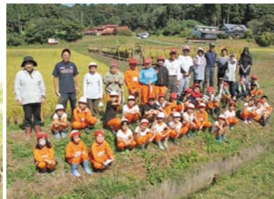
▲全校で最後の学童農園に取り組んだ伊手小のみんな

この日は爽やかな秋晴れとなり、5、6年生が鎌で刈りとった稲を4年生が束ね、1、3年生が運んでほせ掛けしました。児童は「全て手作業でやるのは大変だったけれど、みんなで協力して稲刈りできて楽しかった」と話しました。