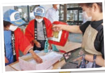
▲恒例の大抽選会はハズレなし。何が当たるかな…?