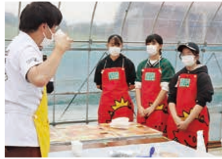
▲江刺の牛乳でバター作りに挑戦！