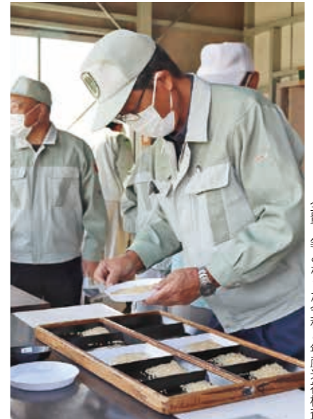
全量1等となった令和4年度米初検査