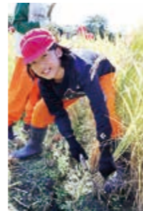
▲鎌で上手に稲を刈りました