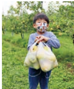
▲袋いっぱいりんごを収穫してニコニコ

江刺青年会議所（江刺JC）は9月23日、江刺の農業を体験する「もぎたて、ぎゅっと、まるっと、江刺狩りツアー」を開催しました。