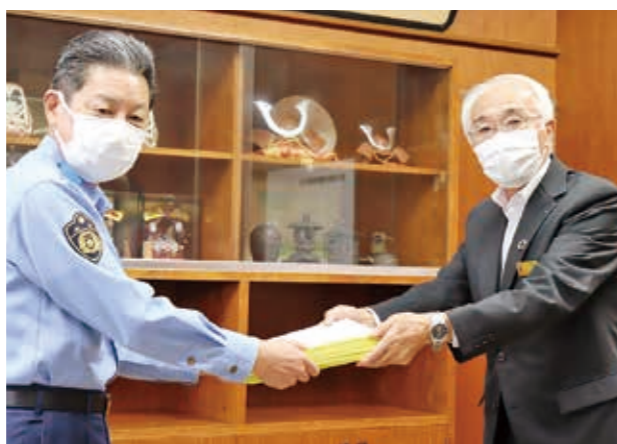
交通安全誓約書を手渡す小川組会長（右）

JA江刺は9月21日、JA役員と子会社の㈱Eーポット、㈱江刺グリーンファームの社員285人が自筆した交通安全誓約書を奥州警察署に提出しました。